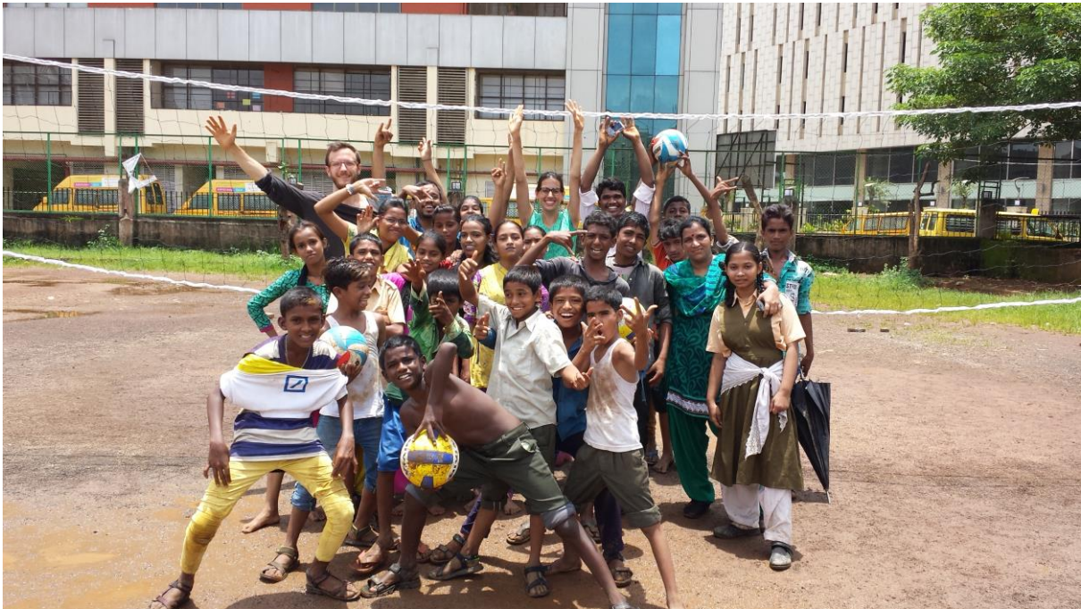
Abbildung 3: Eindrücke vom Sporttag

Im Anschluss an den Sporttag beschlossen die Lehrer das neu gegründete Volleyballteam aufrechtzuerhalten und von nun an regelmäßig zu trainieren. So wurden wir also weiterhin für Volleyballunterricht eingeteilt. Daneben unterrichteten wir täglich unterschiedliche Altersgruppen in Englisch und konnten parallel weitere Einblicke in den Schulalltag bekommen.