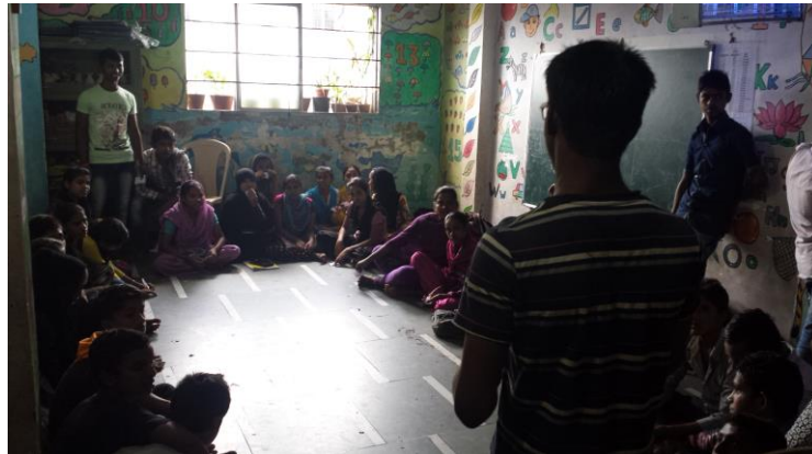
Abbildung 5: Klassensprecherwahl in der Gyansaathi Schule

„Hallo zusammen, heute wurden die neuen Klassensprecher gewählt und wir hatten zwei Klassen in Englisch - die 15-17 jährigen und die Mütter. Die Jugendlichen werden jetzt wo sie uns schon besser kennen zunehmend frecher und so kommen wir mittlerweile auch in Situationen mal etwas lauter zu werden. Die Mütter sind unglaublich wissbegierig.“