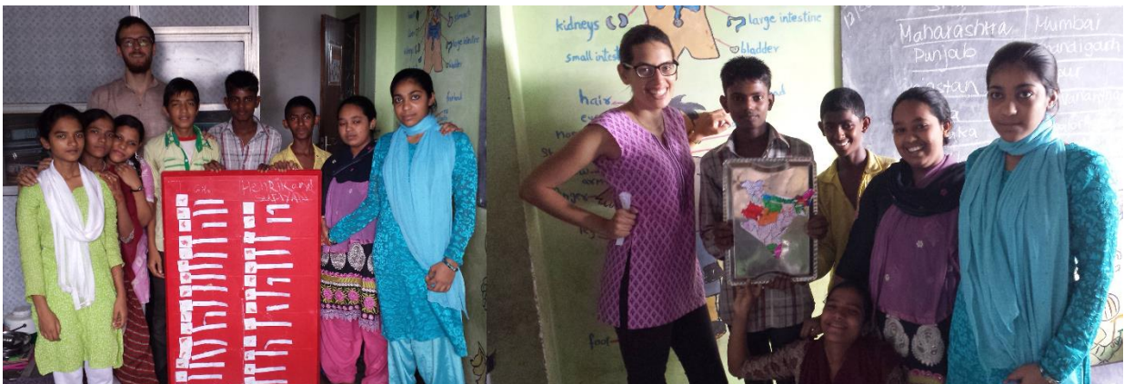
Abbildung 4: Bilder aus dem Unterricht

Im Anschluss an den Sporttag beschlossen die Lehrer das neu gegründete Volleyballteam aufrechtzuerhalten und von nun an regelmäßig zu trainieren. So wurden wir also weiterhin für Volleyballunterricht eingeteilt. Daneben unterrichteten wir täglich unterschiedliche Altersgruppen in Englisch und konnten parallel weitere Einblicke in den Schulalltag bekommen.