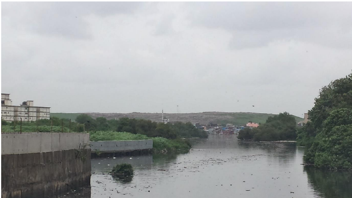
Abbildung 1: Shivaji Nagar, Blick auf den Müllberg und den angrenzenden Slum Govandi. Die Moschee in der Mitte verdeutlicht die stark muslimische Prägung der Gegend.

Shivaji Nagar, der Stadtteil Mumbais in dem sich sowohl der Müllberg als auch die Gyansaathi Schule befinden, liegt im Nordosten der Stadt. Zu unserem großen Glück fanden wir unweit der Schule ein privat vermietetes Zimmer und so verbrachten wir den Tag unserer Ankunft damit, die umliegende Gegend zu erkunden.